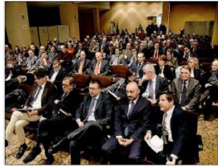
Soddisfazione Industriali entusiasti del cablaggio della rete.