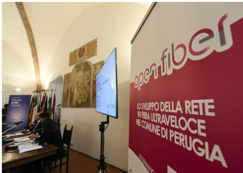
Presentazione del piano di sviluppo della fibra ottica nel Comune di Perugia

Da città umbra parte progetto infrastrutturazione